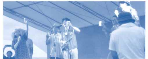
ハッピーサンセットアワー!