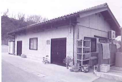
中居土建株式会社 宮城に 432

昨年6月に片町店からのれん分けで開店しました。一番人気看板メニュー「金澤手羽先」は秘伝のタレで仕上げたジュウシーです。お持ち帰りもOKです。