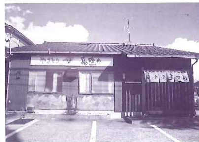
鳥珍や 内灘店 大根布 6丁目 109

安心安全に心掛け、皆様のお役に立つ土木工事に邁進しております。皆様に喜んでいただけるような、高品質の施工を心がけています。