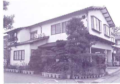
小林清会計事務所 大根布 1-291

会計事務所を開業して、約22年となります。法人・個人事業の方の確定申告や税務書類の作成、税務相談を行っております。税務及び会計のごとお困りの方は気軽に相談ください。