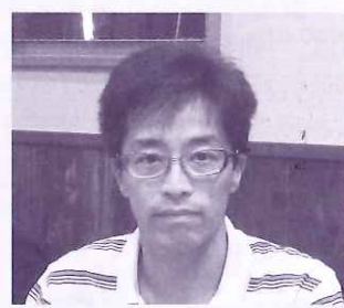
かつとぶれいす クラチ アカシア