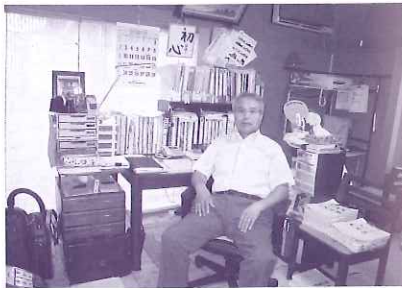
ツサン・コーポレーション 鶴ヶ丘4丁目1-155

今年の11月1日、開業3年を迎えるまだ歴史の浅い会社です。事業内容は、企業、お店、イベント等のユニフォーム、制服、安全用品、防災用品等を石川県内全域に販売しています。内灘町内にもたくさんのお客さまがありお世話になり有難うございます。これからも、お客様に本当に喜ばれる商品をご提供させて頂きます。